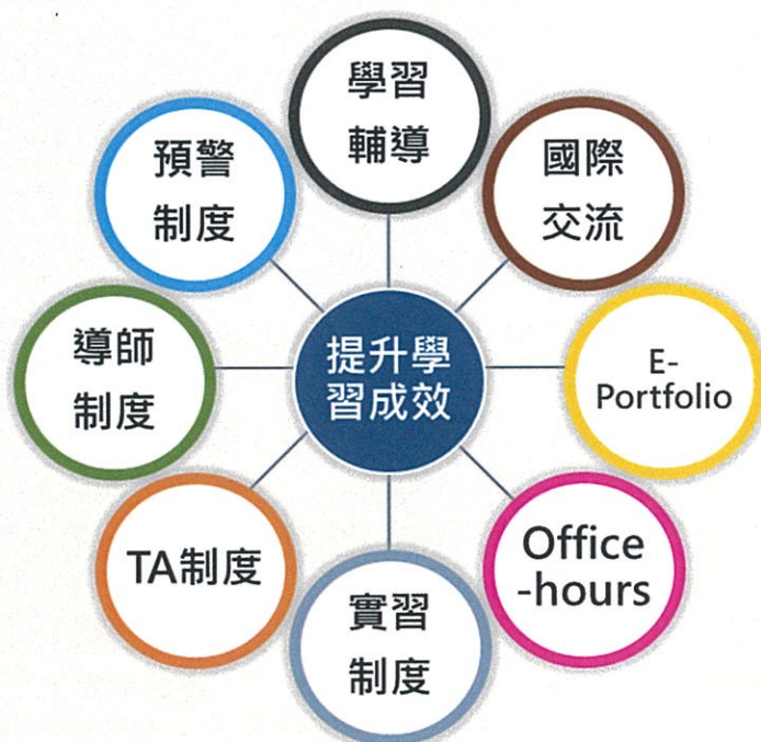
圖3-1-2 校內各項的輔導與學習資源