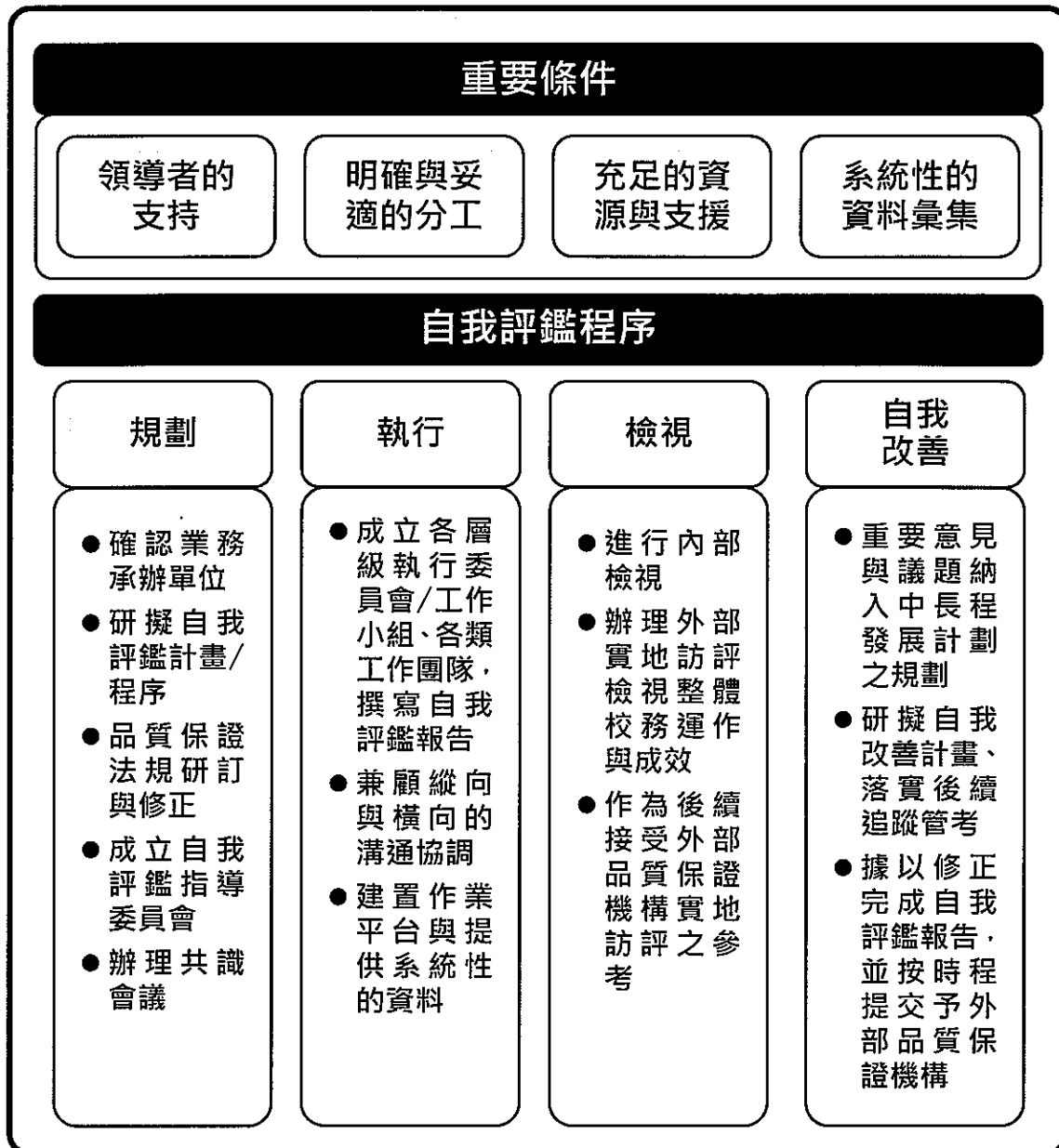
圖 2 校務自我評鑑程序圖